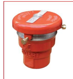
Nadciśnieniowo- podciśnieniowy zawór oddechowy (model 197 SM)