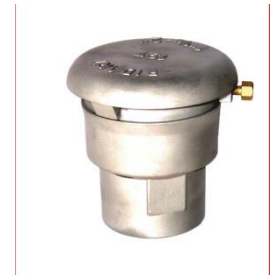
Nadciśnieniowo- podciśnieniowy zawór oddechowy (model 197)