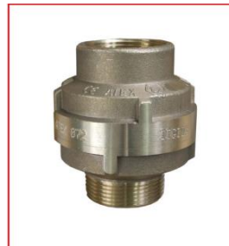
Przerywacz płomienia (model 180 EN)